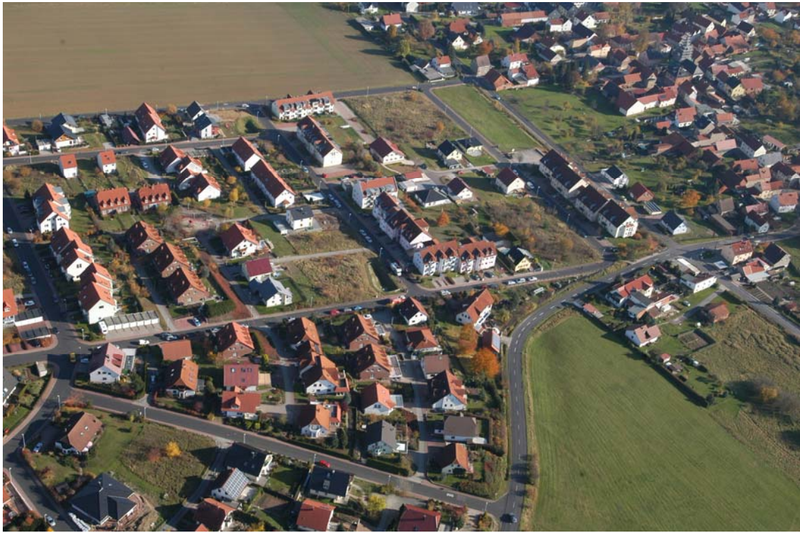
Luftbild PolHubSt (11)