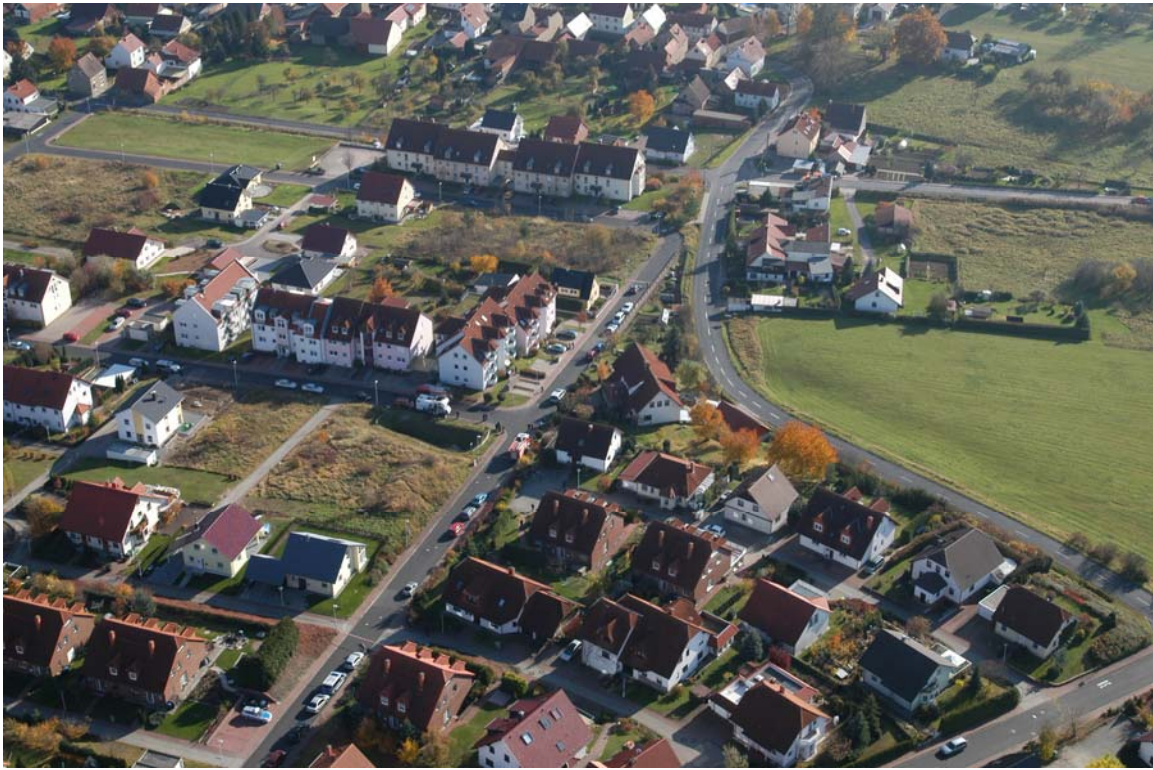
Luftbild PolHubSt (3)