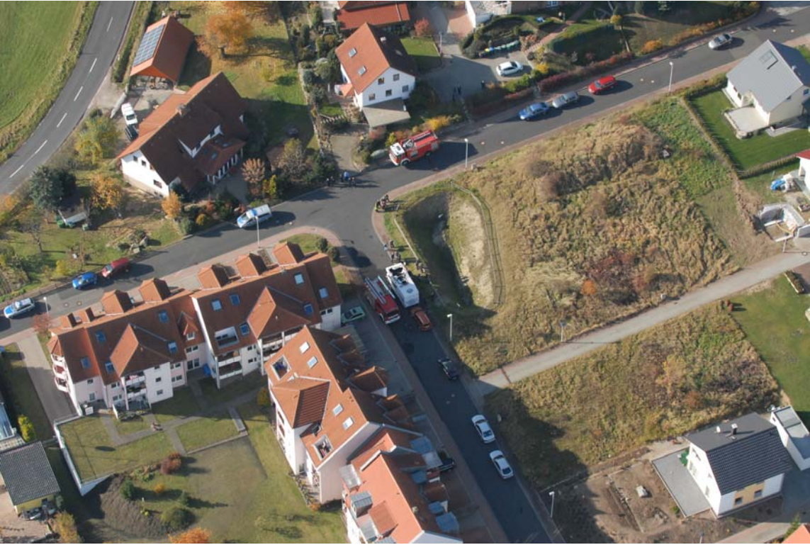
Luftbild PolHubSt (1)